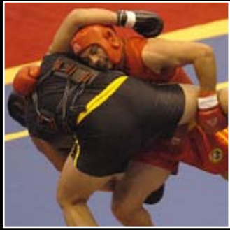
SPORT KOMBAT SANDA