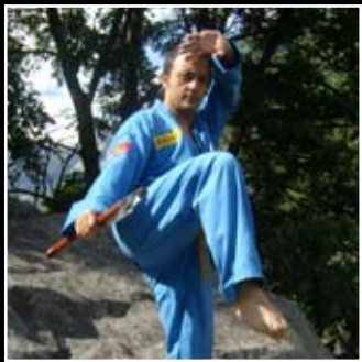
MARTIAL ARTS VIET VO DAO