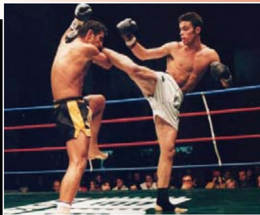
SPORT KOMBAT MUAY THAI