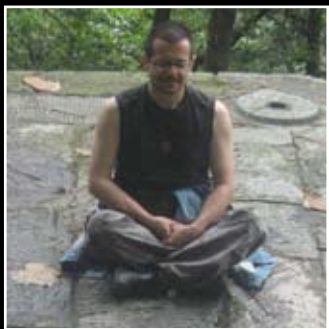
ESOSCENCE QI GONG