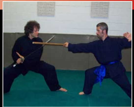
MARTIAL ARTS - KUNG FU ALLA RICERCA DELLE ORIGINI