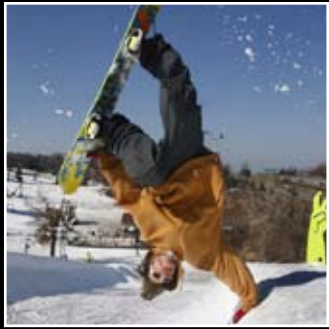
ACTION SPORTS SNOW BOARD