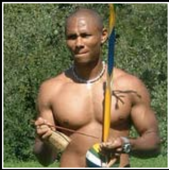
MARTIAL ARTS CAPOEIRA